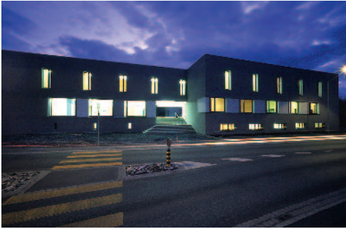
Liechtensteinische Musikschule, Triesen