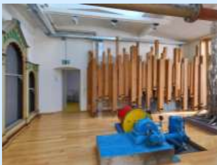
Grosse Objekte (Orgel von 1899) aus dem Alten Vereinshaus in der Ausstellung im Gasometer 2018