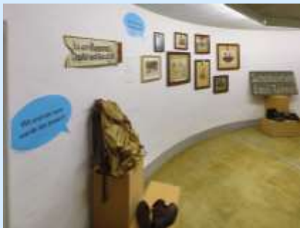
Kleine Objekte aus dem Bestand Frühmesserhaus in der Ausstellung im Gasometer 2018