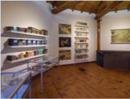
Teilbestand Primarschularchiv in der Ausstellung im Gasometer 2018