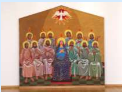
Altarbild «Pfingstszene mit Hl. Maria im Zentrum» Johannes Hugentobler 1943