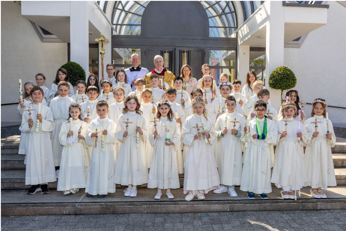
so markierte Gottesdienste werden im Gemeindekanal live übertragen