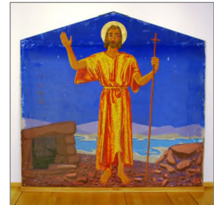
Sakrales und Glaube im Alltag