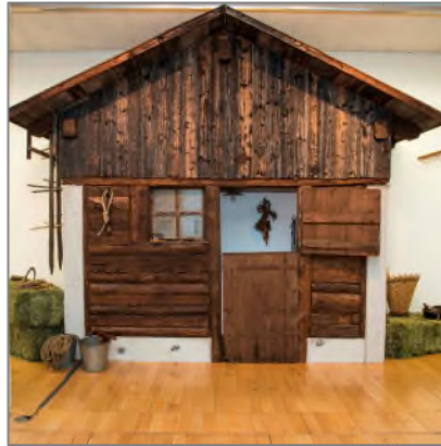
Heuberge und Landwirtschaft in Triesen