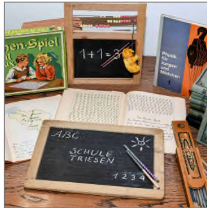
Bildung von A-Z